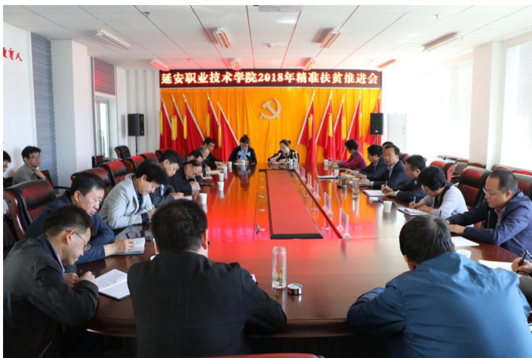
图 2-4 学校召开 2018 年精准扶贫推进会

优化人才培养模式，制定企业个性化的人才标准，实现教学内容对接职业标准，教学过程对接生产过程，毕业证书对接职业资格证书。企业参与人才培养全过程，建设基于工作内容和典型工作过程的专业课程体系，校企共同参与制定了人才培养方案6个，制定了课程标准18个，共同开发基于岗位标准的核心课程教材5门，使教学内容更具岗位针对性，突出教学过程的实践性、开放性和职业性。校企双方强化“双导师”队伍建设，建立有学校专业指导教师和企业技术骨干组成的教学团队5个，通过“双向挂职锻炼”“能工巧匠进校园”等措施，加强培养培训，提升教学水平，初步建立了一支品质优良、技能过硬的“双导师”队伍。强化适应现代学徒制人才培养模式的实训基地建设。建成理实一体化校内实训室16个，大师工作室5个。