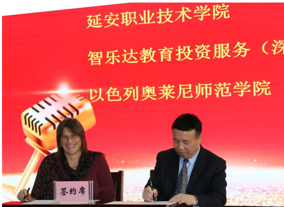
图 2-2 学校与以色列奥莱尼师范学院签订国际交流合作协议

学校全方位、多渠道开拓国际合作。制定了《国外专家（文教类）聘请管理办法》，成立了国外专家发展中心，搭建了与国外专家合作交流平台。承办了2018年中国-以色列国际学前教育学术研讨会；组织17名管理干部和专业教师分两批赴德国、法国开展为期8天和28天的交流学习，深入学习代根多夫应用技术大学职业教育思想、“双元制”人才培养模式应用和实训室建设、利用经验，学习欧洲发达国家职业教育理念，领会双元