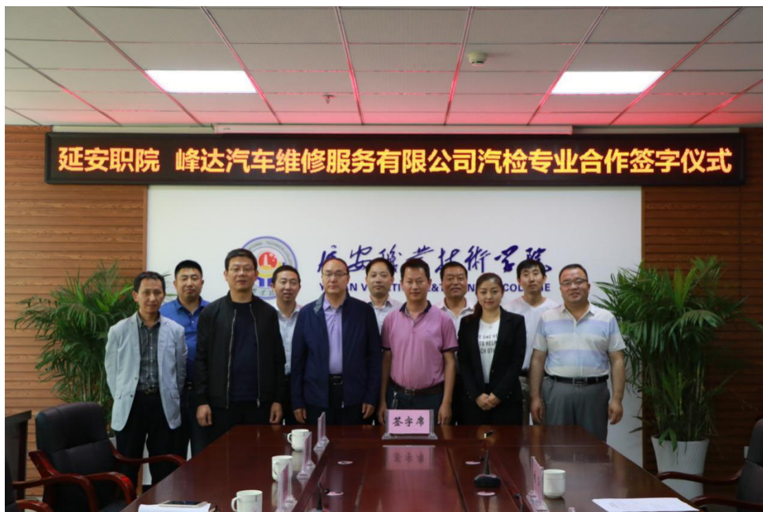
图 2-3 学校与丰达汽车维修服务有限公司签订合作办学协议

引入延安市宝塔区峰达汽车维修服务有限公司进驻校内实训工厂，共建汽车监测与维修专业生产性实训基地；与北方汽修集团合作，共建汽修实训室；与大连理工科技有限公司合作，共建罗克韦尔工业自动化技术协同创新中心。与中职北方智扬（北京）教育科技有限公司合作，以共同投资、共同教学、共同管理的方式合作共建汽车专业学历教育，培养符合市场需求的技术技能型人才。