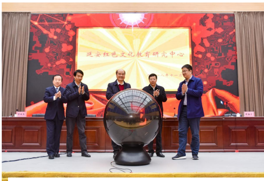
图 1-3 成立延安红色文化教育研究中心

(2) 文化育人功能凸显。一是将红色文化与办学理念深度融合，确立了“延安精神立院，德能并重育人”的办学使命；将理想信念的教育融入办学育人全过程，形成了“传承枣园灯火、培育能工巧匠”的延职精神；以红色元素为主基调，设计、创作了学院校旗、校徽、校歌，有效彰显延安精神的育人功能。二是常年坚持开展校园科技文化艺术节，实行系部轮值承办，做到了“周周有特色、天天有活动、人人能参与、系系呈亮点”，为学生搭建了“参与就在眼前、参与就有快乐、参与就能提高”的重要平台，让每个学生都有展示的机会。三是坚持周一升国旗，天天出早操，从课前喊“起立”、下课致“再见”、就餐讲秩序、言行讲礼貌等细节抓起，强化学生的养成教育，成为学生管理的鲜明特色。四是充分发挥西部海员培训基地、定向培养士官院校的特色作用，大力培育海洋文化、军营文化，并使之与红色文化相互交融，形成了学校特色文化。