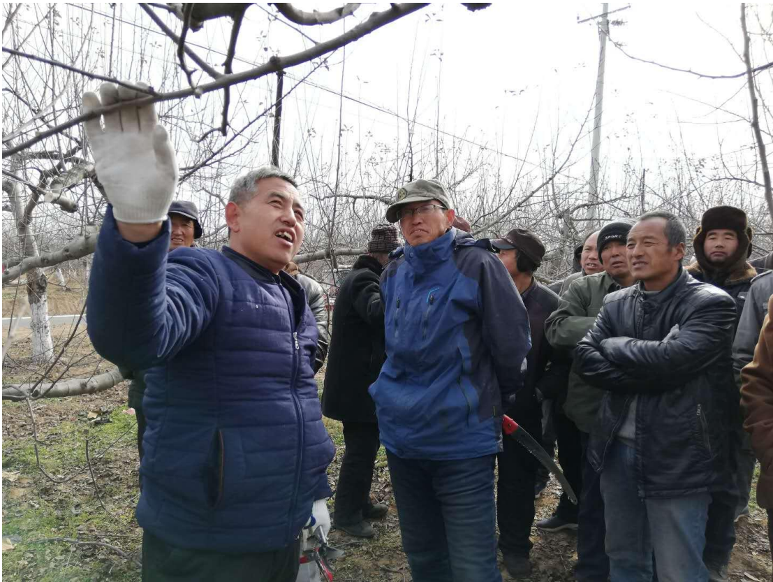
图 2-5 学校果树专家为村民讲授果树修剪知识

我校积极承担省、市安排的各项扶贫工作任务，健全扶贫工作机制，配强扶贫工作人员，发挥学校自身资源优势，在义务教育质量提升、贫困人口技术技能提高、产学研一体化基地建设等方面精准发力。累计投入资金30多万元，协调社会资金150多万元；院级领导指导、参与扶贫活动30余次；建立产学研一体化基地1个，特色产业基地5个，长期教育结对帮扶