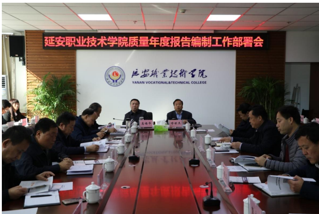
图 2-7 召开质量年度报告编制工作部署会

学校实行校、系（院）两级管理，职能处室发挥宏观管理和服务保障作用，二级教学单位拥有相应的人权、财权和事权，扩大和增强了的人才