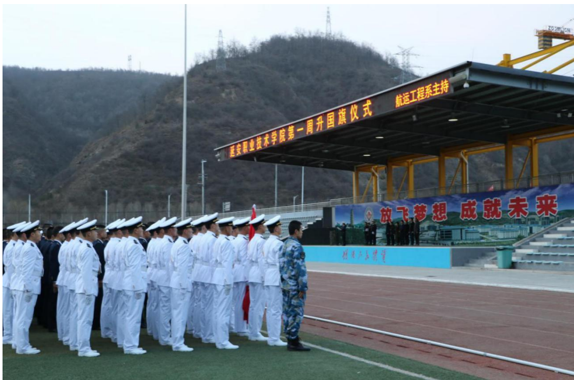
图 2-6 航运工程系轮值的升国旗仪式

学校传承“延安精神立院，德能并重育人”的办学使命，持续推进“延安精神为本、工匠精神为魂、特色文化为根”的校园文化体系建设，营造