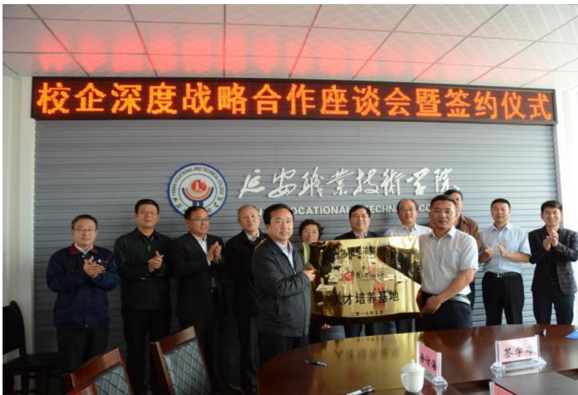
图 2-1 学校与丰达汽车维修服务有限公司签订合作办学协议

评价，课堂教学由仅注重知识传授向更加注重能力素质培养转变。三年来，在陕西省高职院校信息化大赛中取得55个奖项，其中一等奖11个，居陕西省高职院校前列。