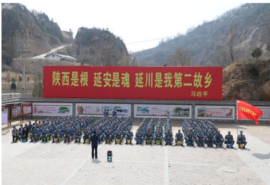
图 2-8 海军定向培养士官生现场聆听习近平在梁家河的知青岁月

学校秉持“创新 开放 务实”的办学理念，高度重视高职教育研究，成立了高职教育研究中心，制定了《高职教育研究机构管理办法》《科研项目管理办法》，修订了《科研成果奖励办法》，设立了教育教学改革专项基金课题、科研课题，单独评审立项。三年来，共确立了55项课题，安排资助专项基金25万元；签订延安市科技发展计划项目16项，延安市社会科学界社科专项资金项目3项，陕西职教学会立项课题13项，陕西省“十