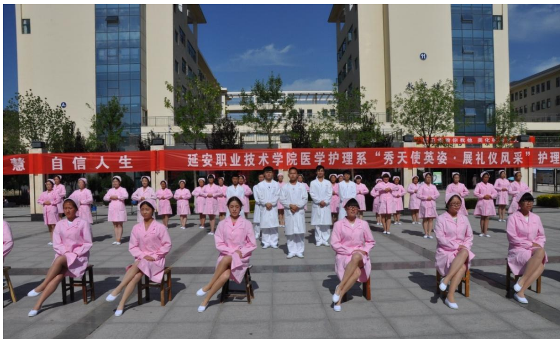
图 2-10 举办护理礼仪比赛

发挥学校历史沿革、专业发展历程、杰出人物事迹的文化育人作用；围绕传播职业精神组织第二课堂，弘扬以德为先、追求技艺、重视传承的中华优秀传统文化；强化实训基地内涵建设，深化产教融合，通过职业实践、顶岗实习，在实践中理解、践行职业精神，达到职业技能培养与职业精神养成的深度融合。