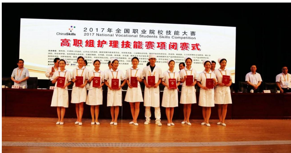
图 2-9 2017 年护理专业学生荣获全国技能大赛三等奖

在注重技术应用能力培养的同时，突出对学生职业道德和职业素质的培养，实施全程跟踪监控，培育职业道德和职业精神。充分发挥校园文化对职业精神的养成作用，推进优秀产业文化进学校、企业文化进校园、职业文化进课堂；利用学校科技文化艺术节成果展、鲁艺校史馆、图书馆等，